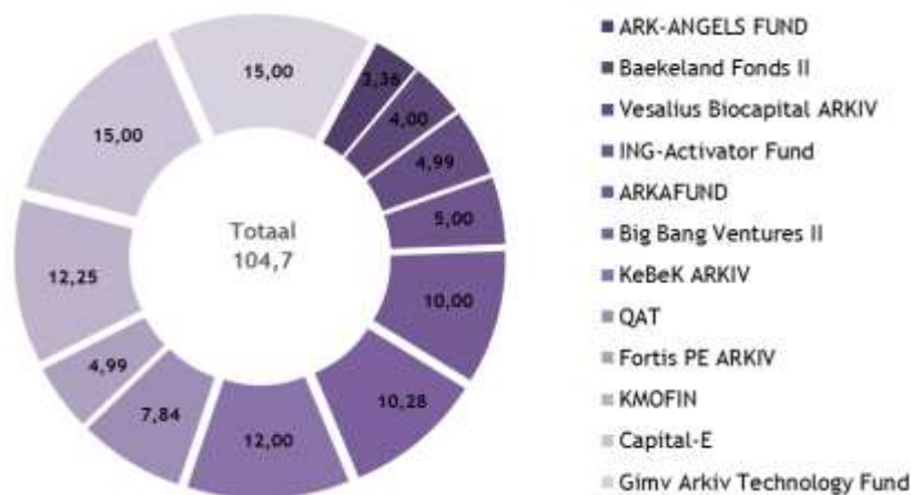
Figuur 1: Initieel toegezegd bedrag (x mln. EUR)